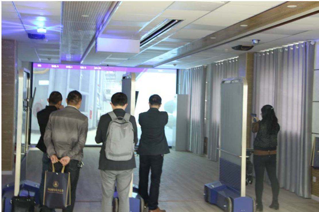
（参会代表参观公安仿真实验室）

随后，各常务理事召开了湖北省高等学校实验室工作研究会常务理事会议，对本年度研究会工作安排进行了部署。会后，代表们参观了中南财经政法大学国家级实验教学中心法学实验教学中心公安仿真实验室。